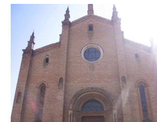
PARROCCHIA di SAN FIORENZO UNITÀ PASTORALE DI BARABASCA, BASELICA DUCE, FIORENZUOLA D'ARDA E SAN PROTASO

Trimestralmente si darà resoconto della gestione del fondo, attraverso il bollettino parrocchiale "L'idea" e il sito www.parrocchiasanfiorenzo.it .